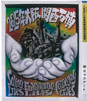
第三ミヤクアート