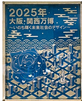
◆滋賀県知事賞 サインリンク(株)